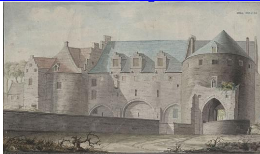
View of the Laeken Gate in Brussels - PUL VITZTHUMB FECIT XXII AVRIL CDDCCLXXXVI - 201 x 334 mm.jpg1,527 x 891; 190 KB

https://commons.wikimedia.org/wiki/Category:%C3%89mile_Puttaert?uselang=nl#mw-subcategories