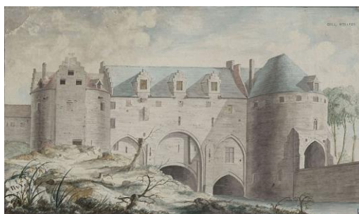
View of the Laeken Gate in Brussels, 1786, 198 x 329 mm.jpg1,524 x 889; 193 KB

https://commons.wikimedia.org/wiki/File:View_of_the_Laeken_Gate_in_Brussels - PUL VITZTHUMB FECIT XXII AVRIL CDDCCLXXXVI - 201 x 334 mm.jpg